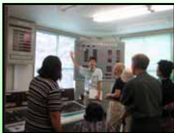
（ダムゲートの操作室）

ダム見学では・・・、 普段なかなかはいることのできない、「ダムゲートの操作室」「ダムゲートの巻き上げ設備」「発電所の内部」などを見学することができます。