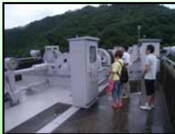
（ダムゲートの巻き上げ設備）