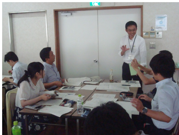
専門家の指導のもと演習に取り組む