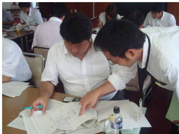
建物図面の見方も含めた演習