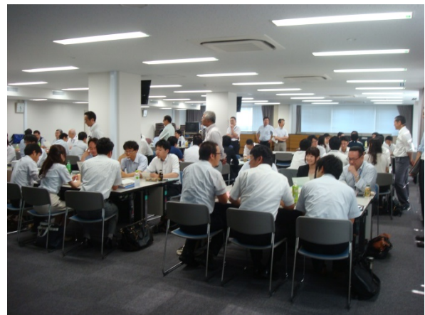
グループ別に用地交渉を実演