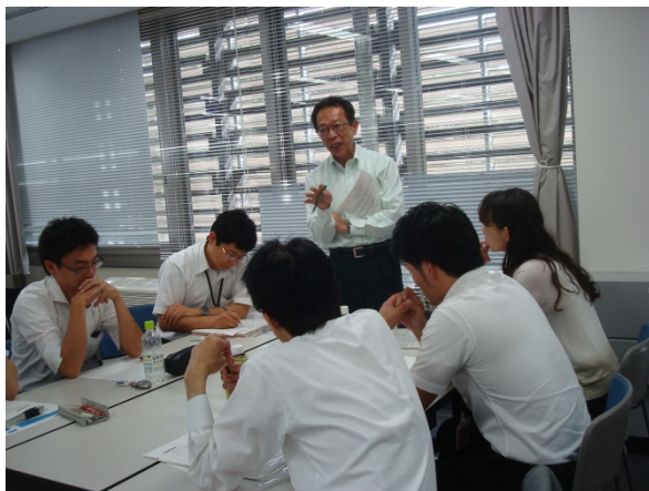
ベテラン職員によるアドバイス