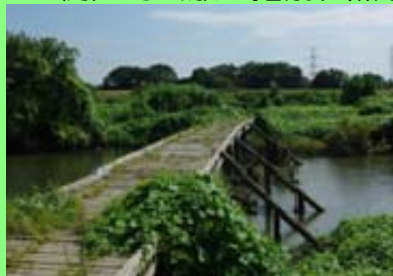
ビオトープの整備