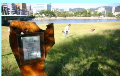
市民団体による看板設置事例（太田川）