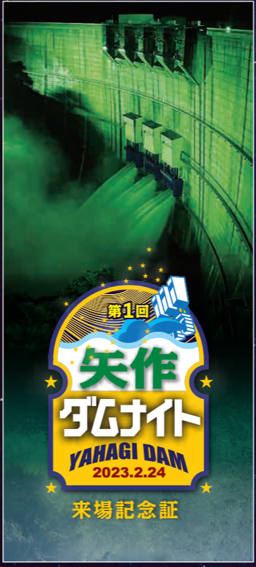
第1回矢作ダムナイト来場記念証

平日昼間の見学会申し込みは計8回(各回定員20名)全て申込開始から2日程度で満員ダムナイトについては定員20名に対し235名の申し込みがありました。抽選の様子をTwitterに掲載、当落メールの送信日やイベント5日前からのカウントダウンでSNSが賑わいました。また当日は参加者へサプライズでシリアル番号入りの来場記念証を渡しました。日没前の17時30分に矢作ダム管理所へ集合し、広報室で矢作ダムの概要