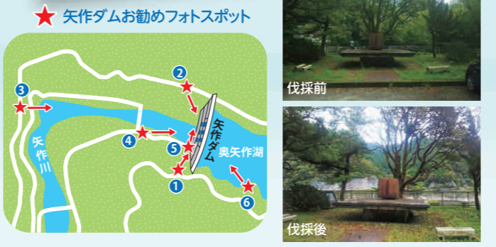
★ 矢作ダムお勧めフォトスポット

令和4年度工事で フォトスポット⑥の箇所にある「矢作ダムの碑」周辺の木を伐採しました。天気の良い日は「逆さ矢作ダム」の撮影も可能です。駐車スペースもありますので矢作ダムへお越しの際は是非寄ってみて下さい。