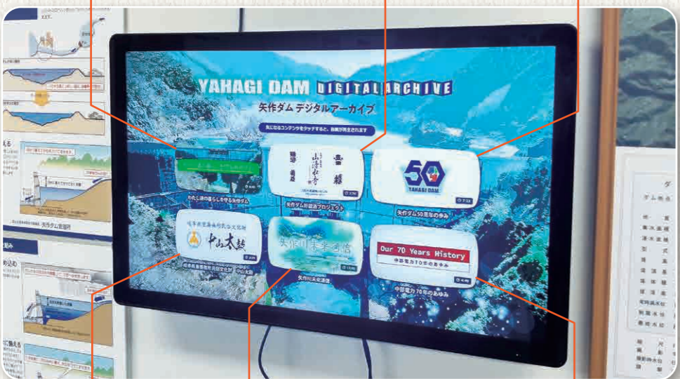
① 広報室新モニター

矢作ダムの50年を振り返る映像として、建設当時の写真や過去の災害の記録、濁水の記録など紹介映像