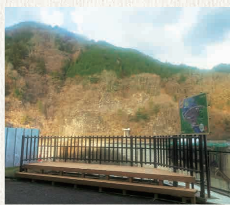
③ 管理所外展望デッキ