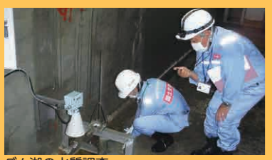
ダム湖の水質調査