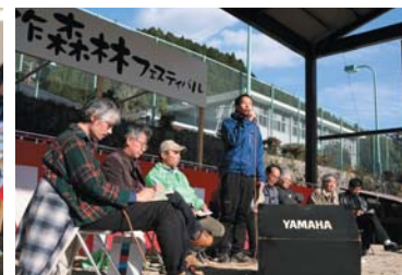
講演会とパネルディスカッションでは、熱心に聞き入る参加者の姿がみられました。