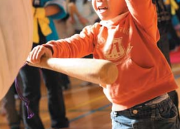
水源地域の郷土芸能である『中山太鼓』と『福寿太鼓』の演奏体験では大きな太鼓の音色に負けないうの歓声が場内に響いていました。