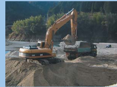
土砂を取り除く作業

ダム湖に貯まる土砂の量がこのまま増え続けてしまうと貯水能力が落ち、ダムは本来持つ機能を発揮できなくなってしまいます。