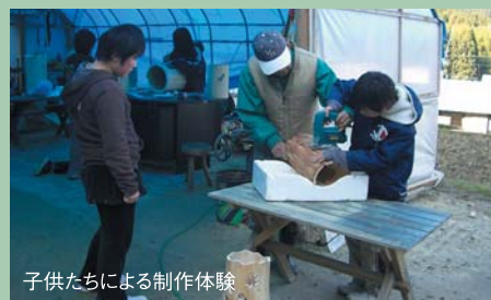
子供たちによる制作体験