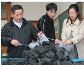
炭は袋に詰めて持ち帰っていただきました。