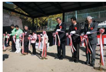
大窯のテープカット。