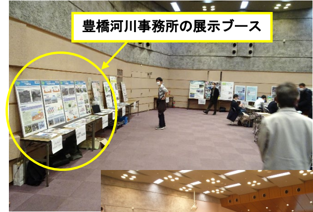
豊橋河川事務所の展示ブース