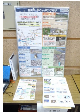
豊川でみられる鳥類、底生動物、魚類の紹介資料