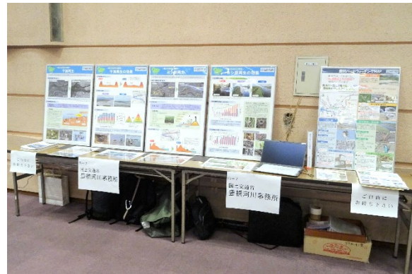
展示ブースの設営状況

【目的】 豊橋河川事務所が実施している「豊川河口干潟再生事業」「ヨシ原再生事業」について知っていただく。また、豊川の干潟やヨシ原などの自然環境に生息する生物に関心を持っていただく。