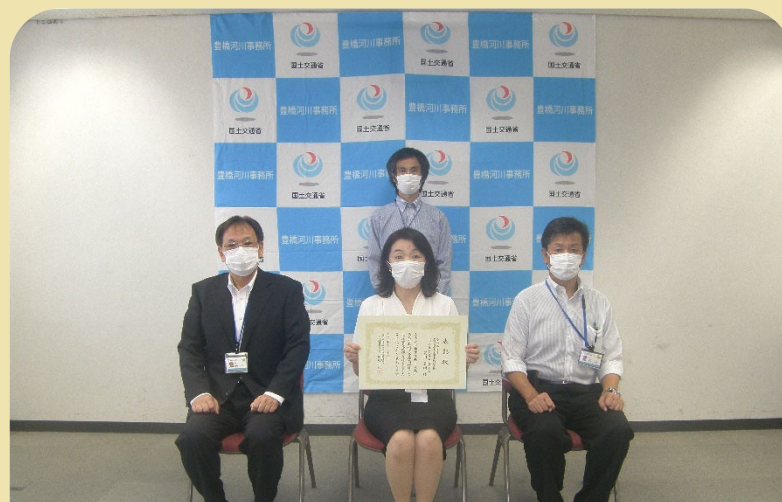
いであ(株) 名古屋支店