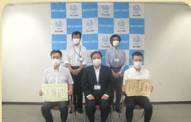
(株)建設環境研究所 中部支社