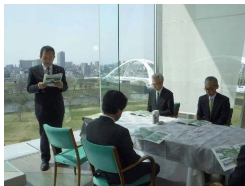
豊田市より概要説明