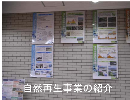
自然再生事業の紹介