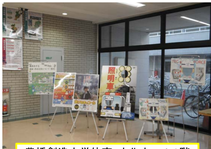
豊橋創造大学体育・文化ホール1階 ミーティングコーナーにて展示