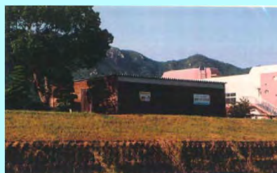
市民団体による活動拠点の整備事例（佐波川）

『特定非営利活動法人 矢作川森林塾』は、平成26年3月14日に河川協力団体の指定を受けており、豊田スタジアム付近における10万本に及ぶ竹林の伐採や外来種の駆除等の活動を通じて、矢作川の環境整備に貢献されています。