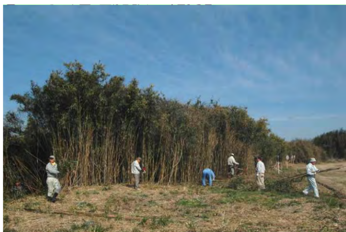
竹林の伐採の様子

『特定非営利活動法人 矢作川森林塾』は、平成26年3月14日に河川協力団体の指定を受けており、豊田スタジアム付近における10万本に及ぶ竹林の伐採や外来種の駆除等の活動を通じて、矢作川の環境整備に貢献されています。