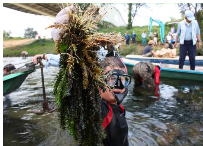
外来種(オオカナダモ)の駆除の様子