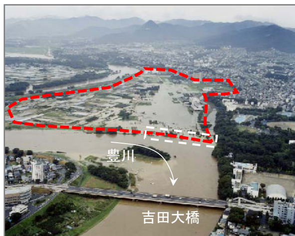
洪水時の牛川霞堤地区（平成15年8月）