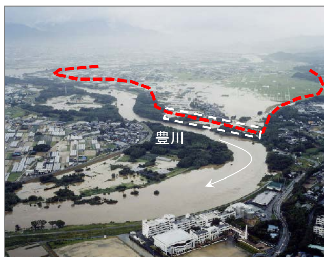
洪水時の下条霞堤地区(平成15年8月)