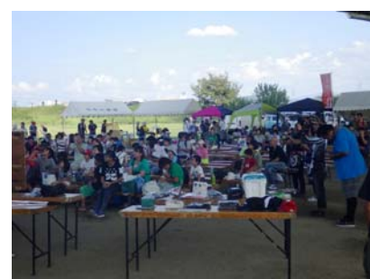
平成 28 年度の矢作川感謝祭の様子