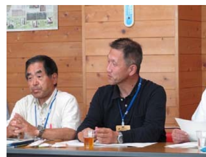
山村ミーティングに関する意見交換の様子