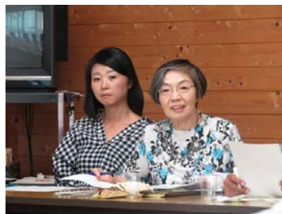
事例集に関する話し合いの様子