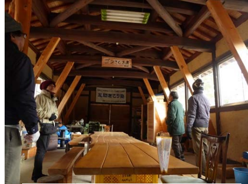
足助きこり塾の視察状況（豊田市）