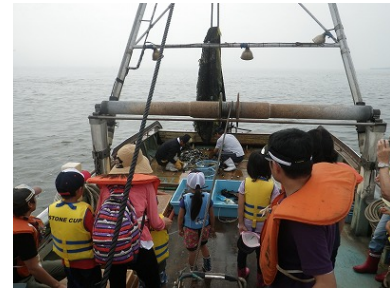
イベントに参加する市民