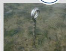
リング法による干潟の計測開始