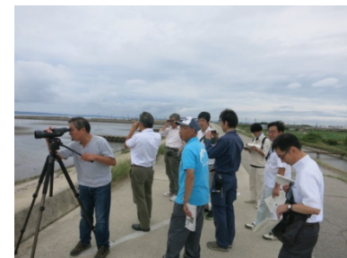
海辺の鳥類観察の様子