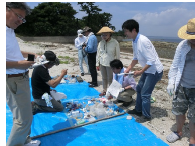
ごみの実態調査の様子