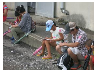
干潟観察会後のアンケート実施状況