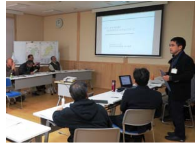
豊田市の海外視察の報告（豊田市）