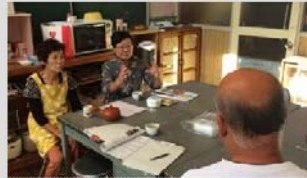
「ねば餅」の取材風景

開催場所は、前回までの WG で根羽村に決定しています。本日は開催日と宿泊先を決めます。