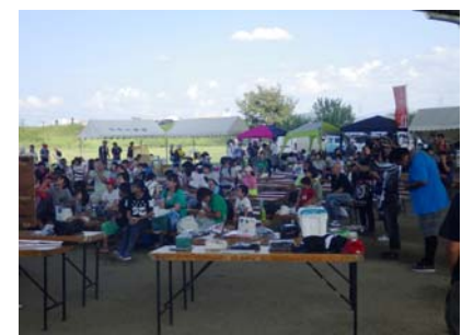
平成 28 年度の矢作川感謝祭の様子