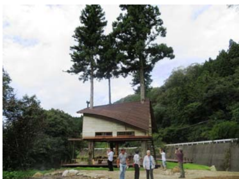
ウッドデザインパークの見学風景（岡崎市）