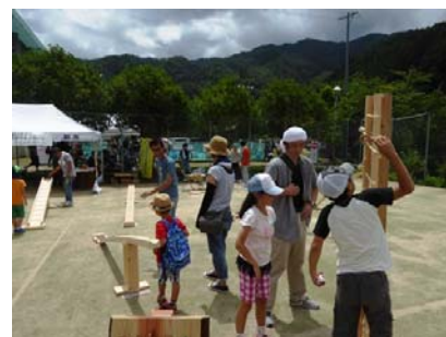
奥矢作森林フェスティバルの実施状況