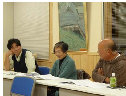
木づかいに関する意見交換の様子