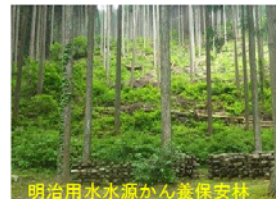
明治用水水源かん養保安林