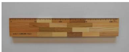
流域ものさし（試作品）