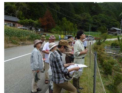
フィールドワークの状況