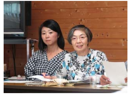
事例集に関する話し合いの様子