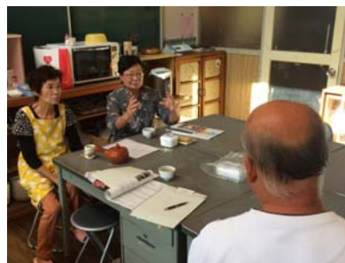
ねば杉っこ餅の取材風景（根羽村）