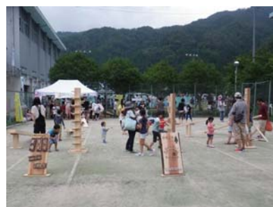
集客力のある木のアイテム（豊田市）