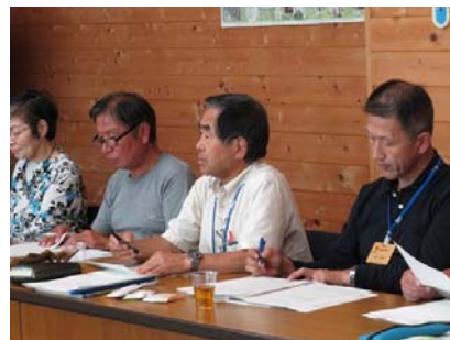
森づくりに関する意見交換の様子