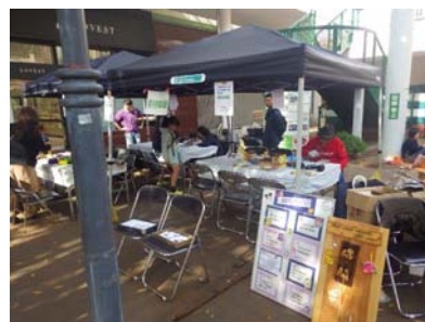
いなかとまちの文化祭における木づかい推進（豊田市）