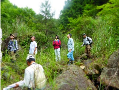
小戸名地区の沢抜け箇所の視察状況（根羽村）