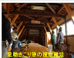
足助きり塾の視察風景