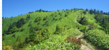
大川入山山頂付近の植生

長野県下伊那郡平谷村に位置する大川入山は、長野・愛知県境の茶臼山（ちゅうすやま）と並び、矢作川源流の山である。また、標高が1,908mと矢作川流域内で唯一亜高山帯植生を有しており、山頂部はダケカンバやシラビソ等の針広混交林となっている。しかし、実際には広大なササ原（シナノザサ）が尾根に対して非対称（西側に偏った）に分布していた。平谷村住民へのヒアリングの結果、少なくとも昭和20年ごろまでに、村内の広い範囲が皆伐されたことがわかった。戦後70年を経過しても、人為的かく乱の傷が癒えていない状況である。特に尾根部では、強烈な西風、土壌の薄さ、シナノザサの優占といった物理的要因が加わり、植生遷移が進んでいない。