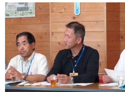
山村ミーティングに関する意見交換の様子