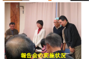
報告会の実施状況