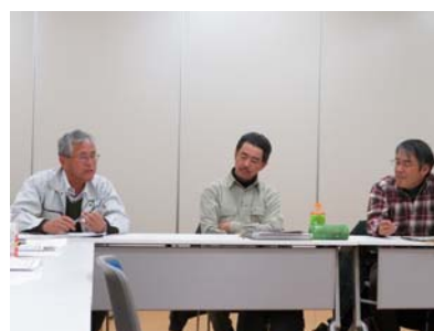
豊田市森林組合との意見交換（豊田市）