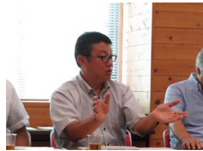
岡崎市の報告の様子（岡崎市）