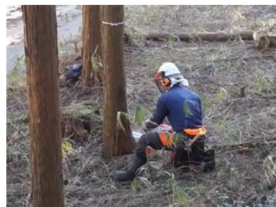
ヒアリング時の作業風景（恵那市）