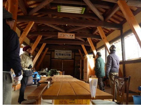
足助きこり塾の視察状況（豊田市）