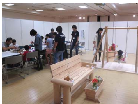
間伐材利用コンクール会場の様子（岡崎