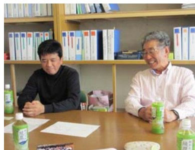
奥矢作森林塾の取材風景（根羽村）