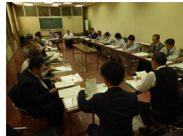
広域サイクリングロード構想に関する意見交換