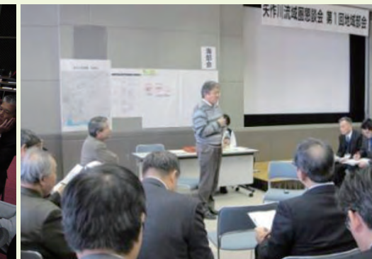
地域部会(海部会)状況