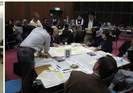
地域部会(川部会)状況