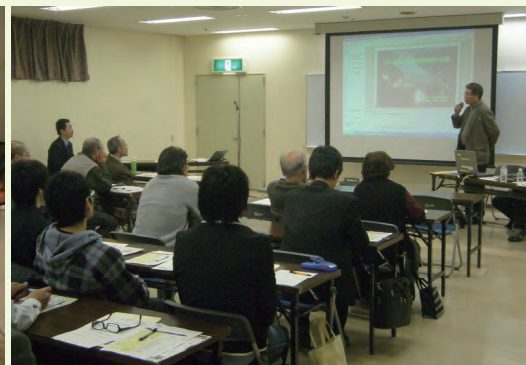
勉強会(山地域)状況