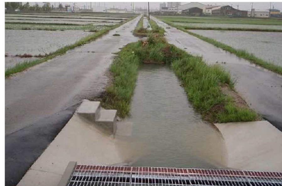
水路流量調整方式による水田貯留の様子（左：平常時、右：大雨時）