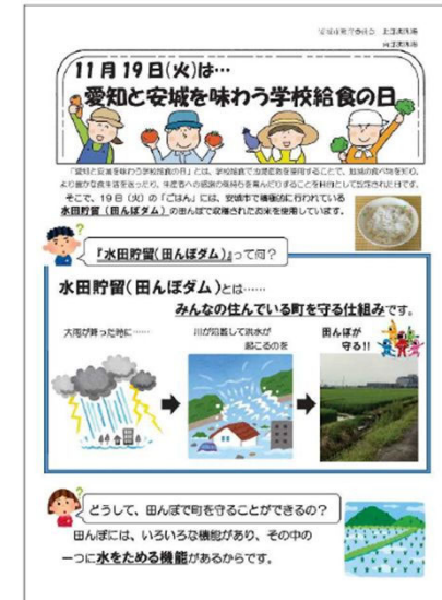
生徒たちに配布したチラシ