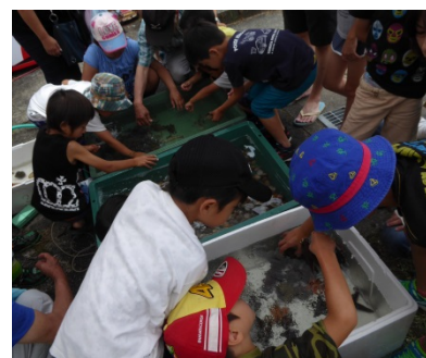
三河湾の魚介類とのふれあいの場の提供