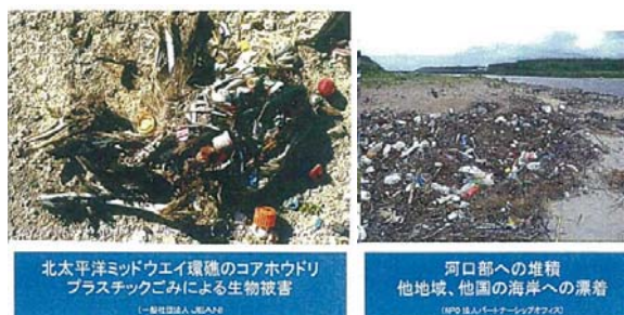
プラスチックごみ問題の提供資料表