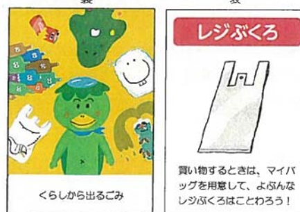
カードゲーム形式のごみ学習教材