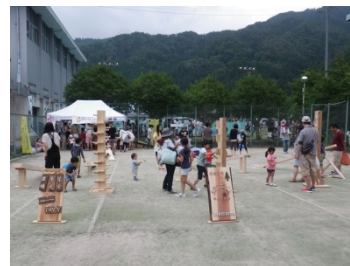
動く木のおもちゃの展示