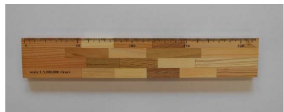
流域ものさし (試作品)