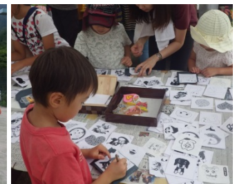
ペンダントづくりの様子