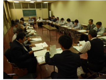
広域サイクリングロード構想に関する意見交換