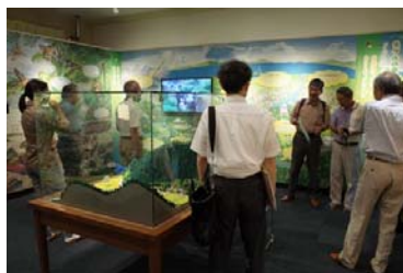
岡崎市ホテル学校の視察の様子