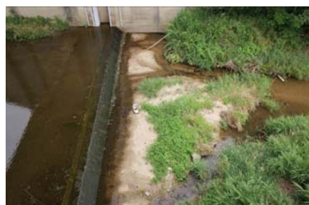
加茂川合流点段差の状況