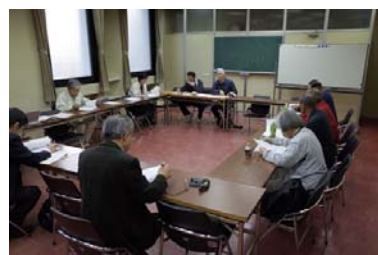
梅坪水辺愛護会との意見交換の様子