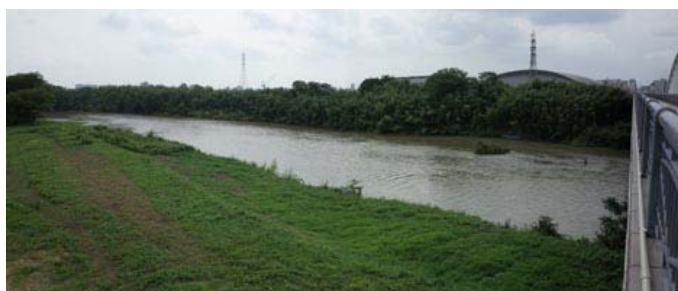
久澄橋から望む下流の瀬の状況（矢作川漁協より説明）