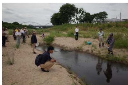
白浜工区のせせらぎの状況