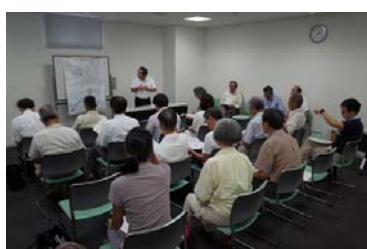
鹿乗川を美しくする会との意見交換の様子