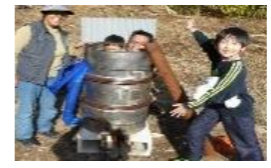
外湯 ドラム缶露天風呂

注意事項： ノートに使用者名・人数等記載→室内・トイレ清掃→火の始末→ゴミを持ち帰る →使用敷布等は縁側廊下奥に入れる→電源を切る→施錠 ・ 駐車場は、R153北上した所に国道側道の無料パーキングがあります。 ・ 家前の川での魚釣りや網等による遊びは漁協の入川チケットを買う事 * 153号道路を下ると根羽市役所すぐに左へ入ると「JAの売店」で売っています。