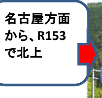
名古屋方面 から、R153 で北上