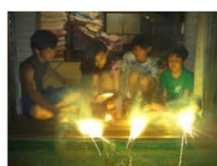
縁側で花火 蚊はいない。