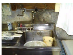
新鮮な溪流取; (カセットコンロあります) 水は出っぱなしに。