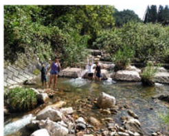
家前の溪流(R153徒歩北上30m 左へ入る取水ゲートから下りる