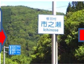
R153の案内看板① (砦橋を渡って直ぐ)