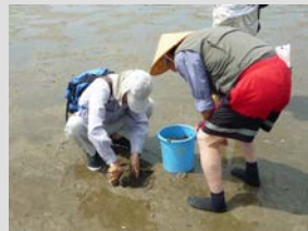
25×25cm の範囲を調べます