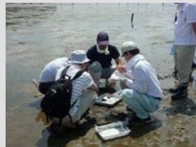
生物名と個数を調べます