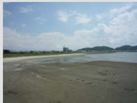
西浦地区人工干潟