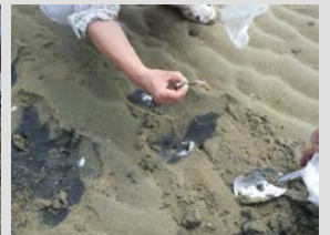
マテガイもたくさんいました！