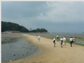
東幡豆町天然干潟

東幡豆町天然干潟、西浦地区人工干潟にて生き物調査を行い、干潟の生物、生息環境の違いを観察しました。