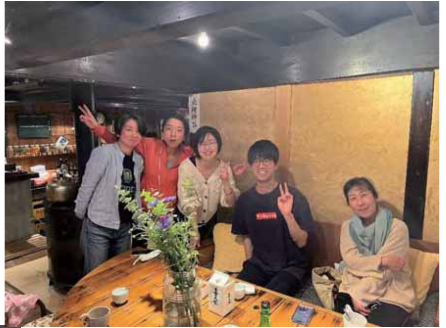
飯田市内 やまいろゲストハウスに集合