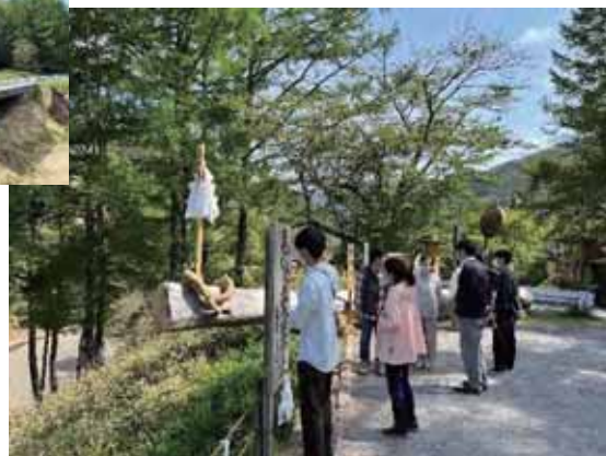
下諏訪町 木落し坂にて 小口さんから御柱祭の丁寧な説明を受ける