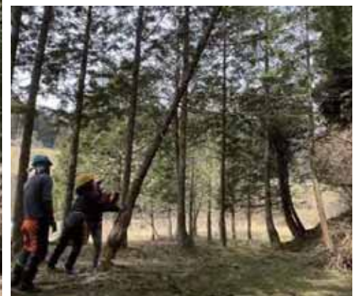
根羽村での林業体験など