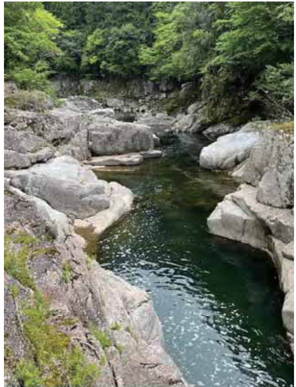
大千瀬川・煮淵ポットホール