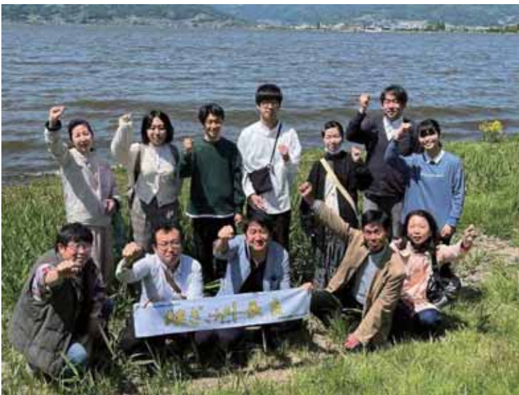
2022年 中部川のワークショップに向けて 諏訪湖畔にてみんなで気合を入れる