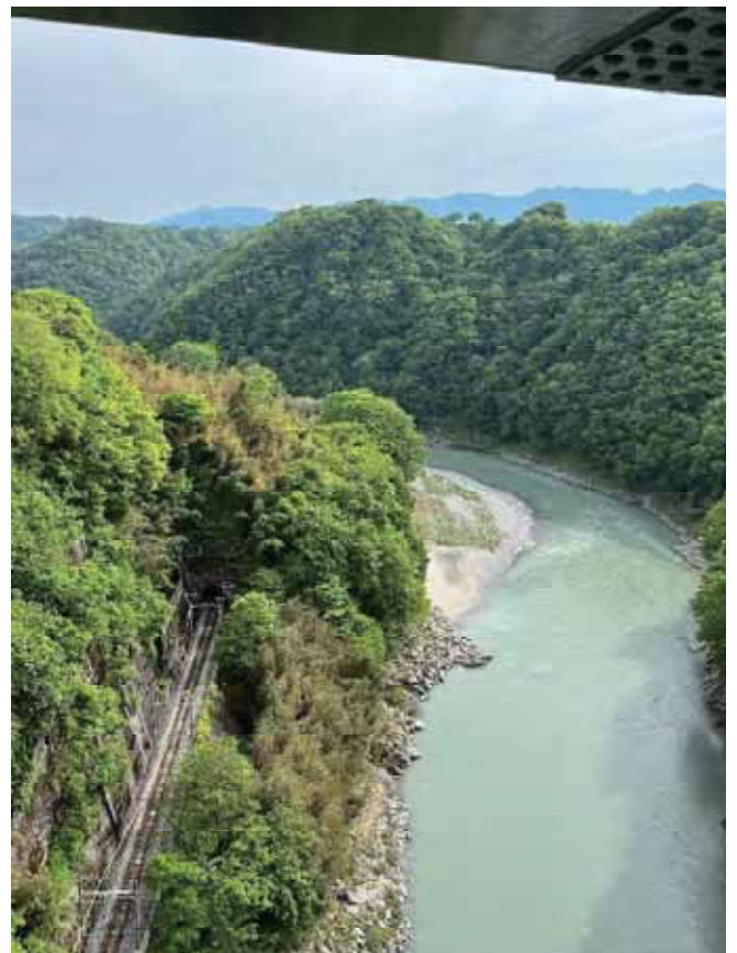
そらさんぼ(左下写真)からの天竜峡の眺め