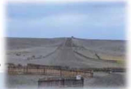
天竜川河口・遠州灘の中田島砂丘 と巨大な防潮堤防(2021年4月撮影)

このエクスカージョンは、今年度実施する予定の中部版「いい川」ワークショップ(2022年11月～12月頃予定)の準備及び下見を兼ねたものであり、矢作川流域圏懇談会を始めとする様々な枠組みの参加を促進させるとともに、多世代にわたる共有の場を創ろうとするものである。学生たちは、この後も矢作川流域圏懇談会バスツアーや、伊勢湾・奈佐の浜プロジェクト答志島合宿などへ向かう。