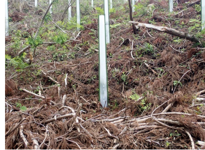
シカによる食害を防止するハイトシェルター