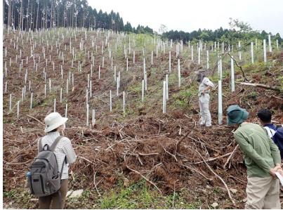
コウヨウザンの試験植栽地。皆伐したところに2250本（1500本/ha）を植栽。

スギやヒノキに比べて成長量が大きな樹種（コウヨウザン）の植栽試験地を見学しました。コウヨウザンが活用できれば、伐期の短縮（50年→30年）となり、育林コストの削減や林齢の平準化などの効果が期待されます。植栽したコウヨウザンは、シカによる食害を防止するため、ハイトシェルターが導入されています。