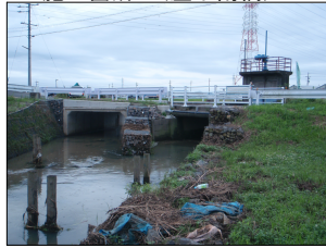
H21施工箇所（屋下南橋）