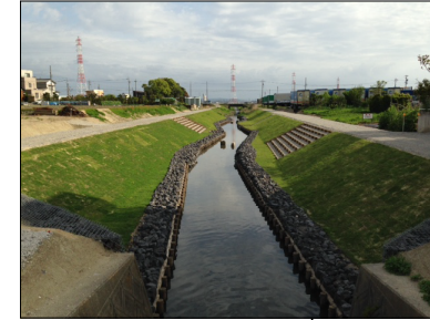
H26施工区間（最上流より望む）