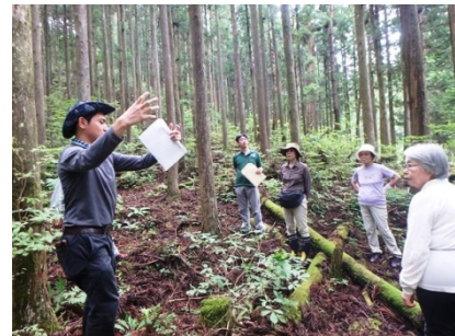
フィールドワークの状況