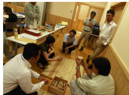
木づかいに関する意見交換の様子