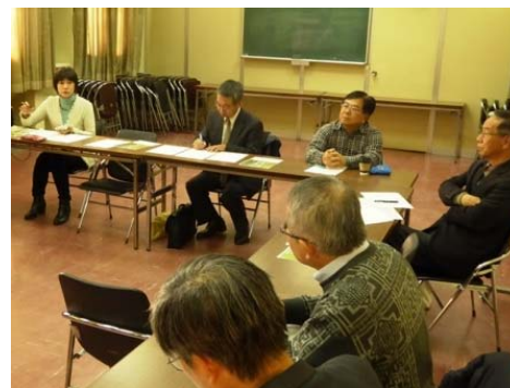
川部会における意見交換