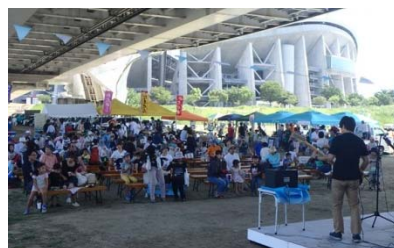
矢作川感謝祭の実施状況