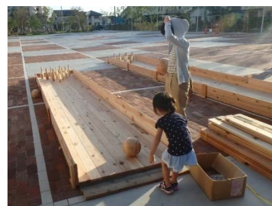
安城市における木づかい推進の様子