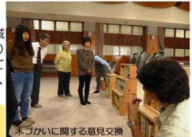
木づかいに関する意見交換

日時：平成 29 年 11 月 10 日 (金) 場所：根羽村老人福祉センター「しゃくなげ」 参加者：11名(事務局を含む)