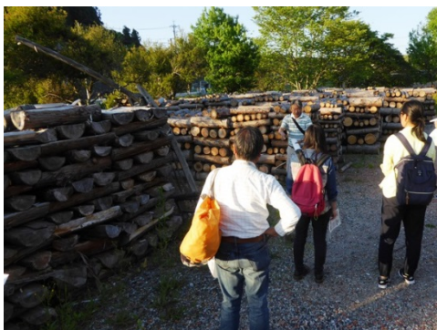
木の駅・薪の駅の見学（恵那市）