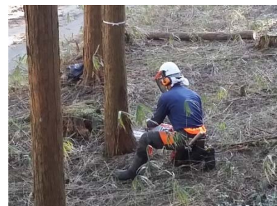
ヒヤリング時の作業風景（恵那市）