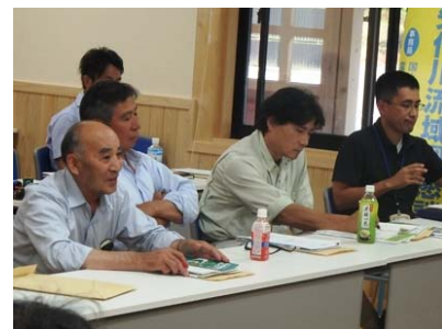
森づくりに関する意見交換