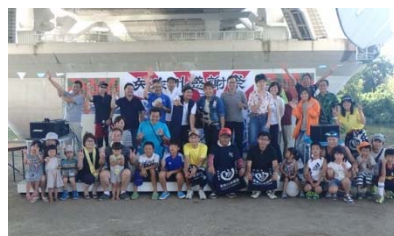
矢作川感謝祭の実行委員