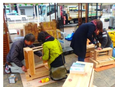
どこでもライブラリー 本箱づくり