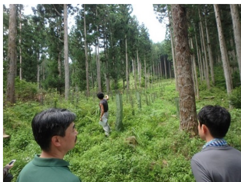
带状間伐の実施状況(根羽村)