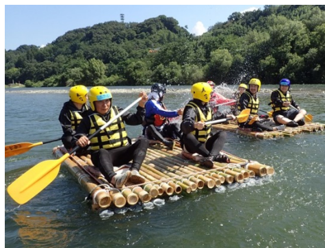
放棄竹林の利活用（飯田市）