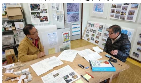
「環境ボランティアサークル亀の子隊」の取材状況