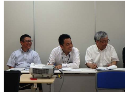
森づくりに関する意見交換の様子