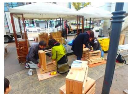
根羽スギを使った本箱づくり