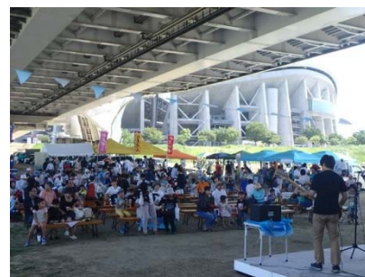
矢作川感謝祭の開催状況（豊田市）