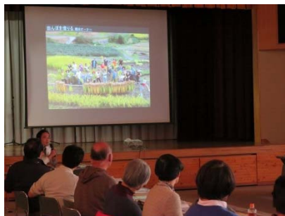
事例集交流会の様子