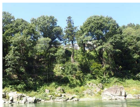
天竜川における竹林伐採箇所の現状(飯田市)