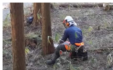
ヒヤリング時の作業風景（恵那市）

・これまでは、豊田市民を対象とする川のイベントだったが、今年度は 山部会の部会員も実行委員会に加わり 、矢作川の上下流の農業、林業といった山の関係者も参加する 流域を対象としたイベントに拡大 した。特に、 根羽森林組合、豊田森林組合、岡崎森林組合が一堂に会する機会を得たのは、大きな成果 だと考えられる。