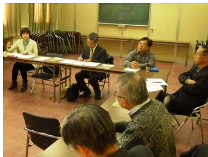
川部会における意見交換