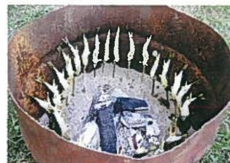
おいしい鮎は、焼き方も美しい。魚の焼き方、魚の食べ方を見れば、魚への愛情がわかる。