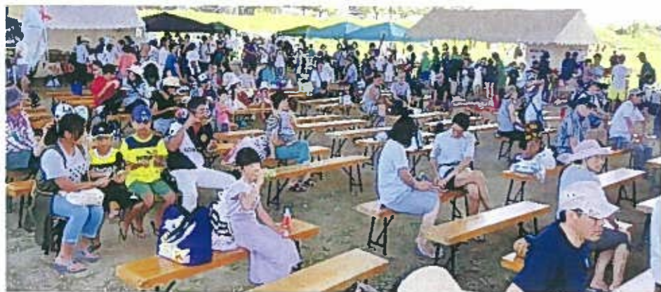
参加者600名で売り切れ店続出。