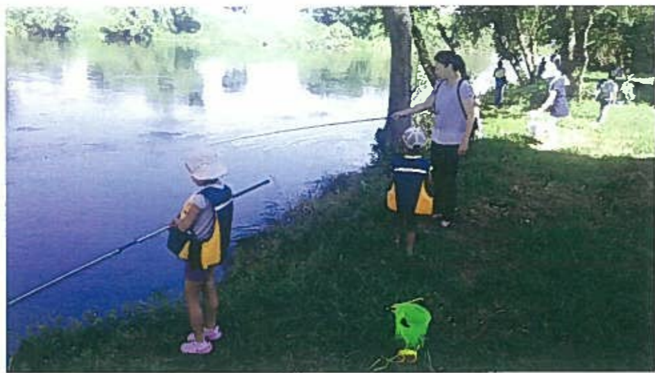
豊田大橋の下で、さかな釣り教室。 こんなところでも、魚が釣れるんだ。