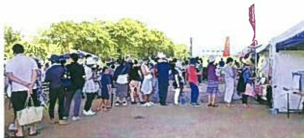
どのお店も長蛇の列。参加者数の予想が立てれず、ご迷惑をおかけしました。