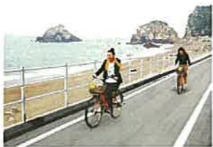
日出休所付近の風景