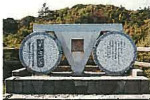
日本の道100選顕彰碑 (渥美サイクリングロード)