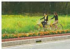
田原市和地町付近の風景