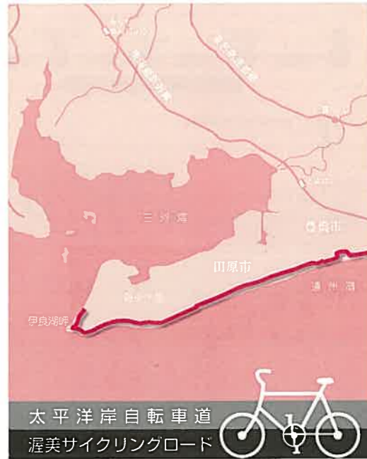
太平洋岸自転車道 渥美サイクリングロード