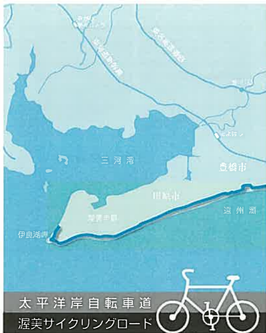
太平洋岸自転車道 渥美サイクリングロード