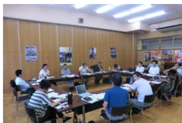
ブレインストーミングの様子