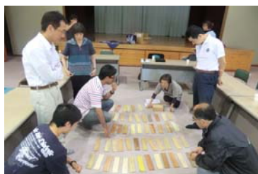
木材の多様さについての紹介