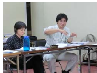
WGでの意見交換の様子