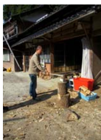
取材時の巻割りの実演