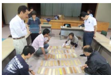
木材の多様さについての紹介