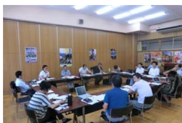
ブレインストーミングの様子