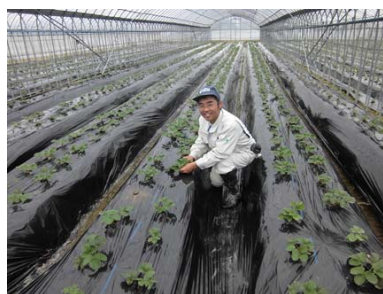
取材先団体の活動の様子