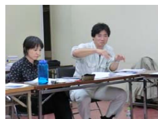
WGでの意見交換の様子