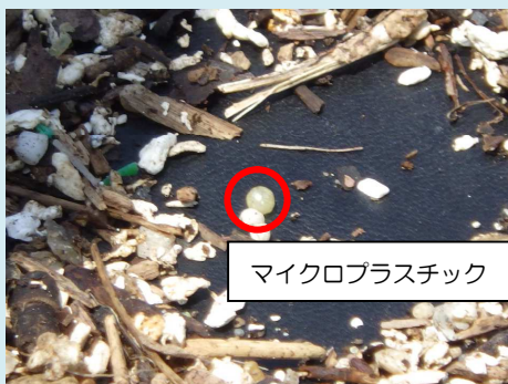
マイクロプラスチック

答志島には、風向や海流の影響で、伊勢湾に漂流するゴミの1/4に当たる年間3,000トンが漂着します。当日もゴミが漂着していましたがそれでもピーク時の1/10程度の量です。また、徐放性肥料プラスチックや人工芝片から流出するマイクロプラスチック（5mm以下のプラスチック片）についても確認しました。マイクロプラスチックは伊勢湾の海苔の養殖にも影響していて、海苔の表面にはマイクロプラスチックが付着し、出荷前に丁寧に除去する手間が発生します。