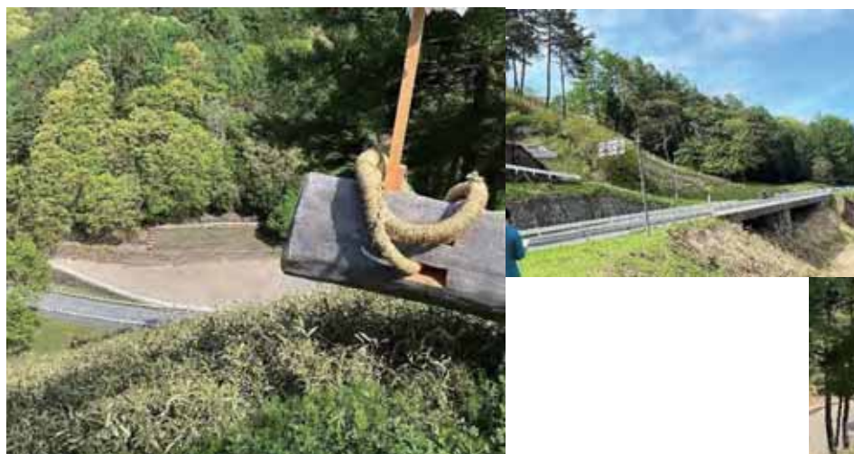
下諏訪町 木落し坂にて 小口さんから御柱祭の丁寧な説明を受ける