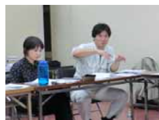
WGでの意見交換の様子