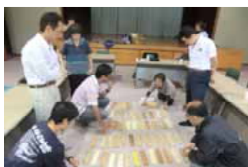
木材の多様さについての紹介