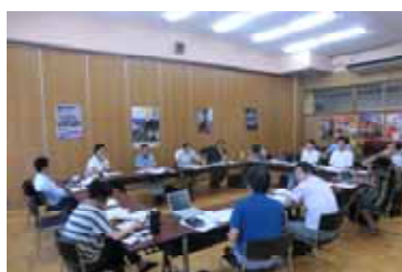
ブレインストーミングの様子