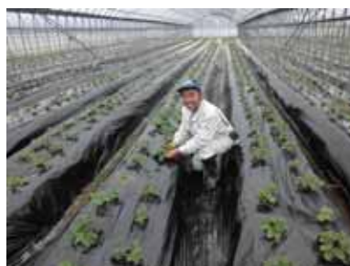
取材先団体の活動の様子