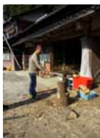
取材時の巻割りの実演