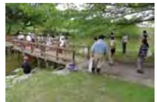
長池での意見交換の様子