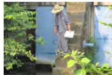
大見川合流部の段差の状況