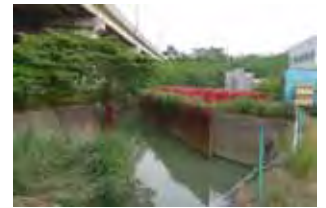
県・市管理境界上流の様子