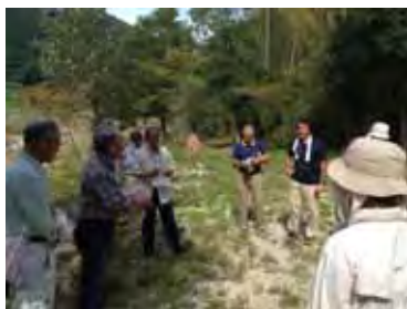
小渡水辺協議会との意見交換