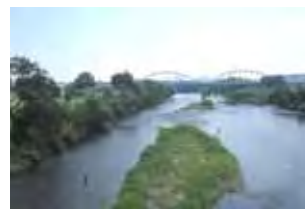
豊田大橋下流の瀬の状況