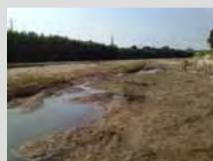
台風18号の出水で埋もれた水路