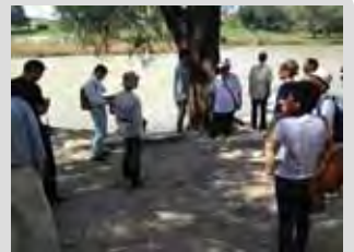
古鼠水辺公園での説明の様子