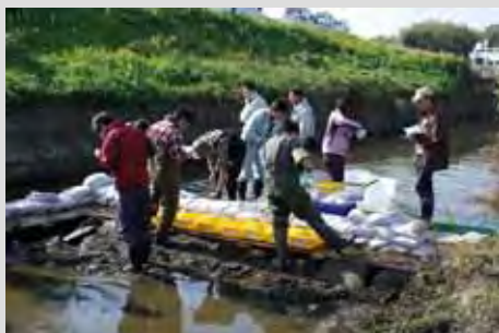
魚の仕分け+計数の様子