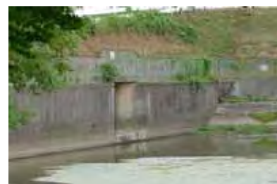
長池ー承水溝の段差