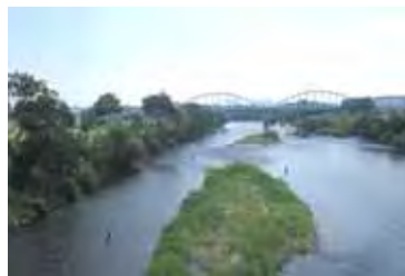
豊田大橋下流の瀬の状況