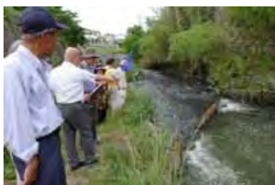
家下川合流点段差改善箇所