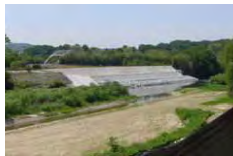
渡合地区の災害復旧の様子