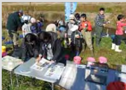
こどもたちによる展示の準備の様子