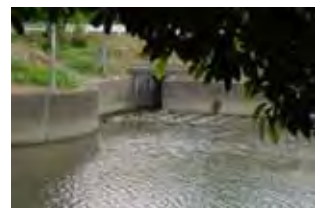
承水溝一矢作川の合流箇所