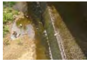
加茂川水門下の段差の状況