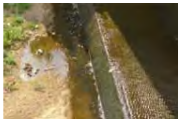
加茂川水門の段差の状況