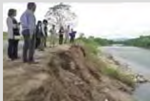
高橋右岸付近の被災の様子 （河岸が削られている）

現地調査では、高橋右岸付近の台風 18 号による被災状況と県管理区間の代表的な瀬・淵の現状について確認しました。