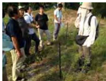
御立公園の将来に残す高木の稚樹 （しるしをつけて管理）