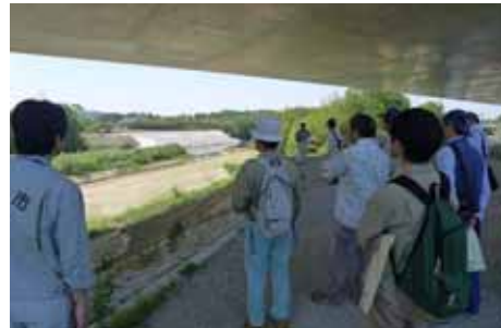
渡合地区対岸での意見交換の様子