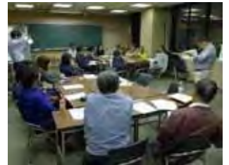
全体ワークの様子