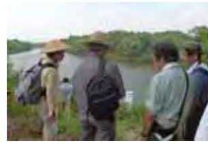
高橋上流の瀬を確認する様子