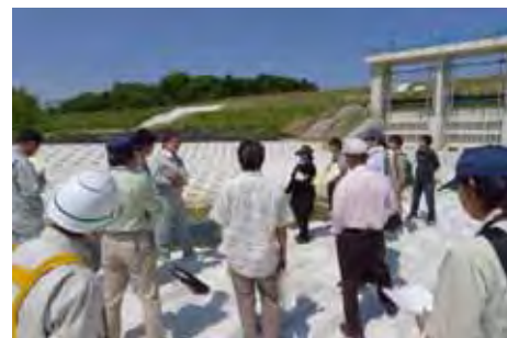
安永川排水樋門での意見交換の様子