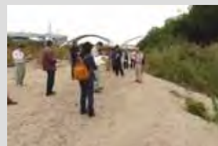
ワンド付近の調査の様子 （出水後もワンド形状は保持）