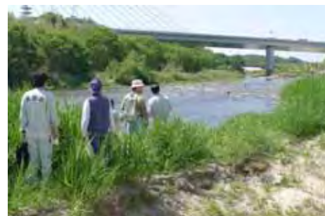
安永川合流点下流の瀬の様子