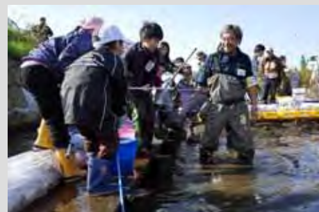
小学生の捕獲タイム