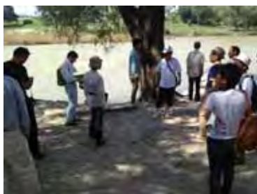
古巣水辺公園での意見交換