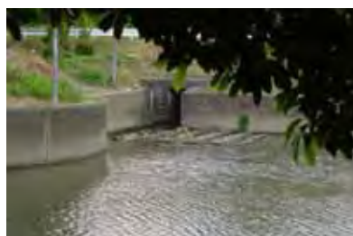
承水溝ー矢作川の合流箇所