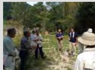
小渡での意見交換会の様子