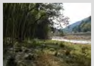
元々の竹林のイメージ