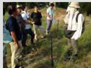
しるしをつけた稚樹