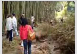
台風 18 号の出水でなぎ倒された竹林