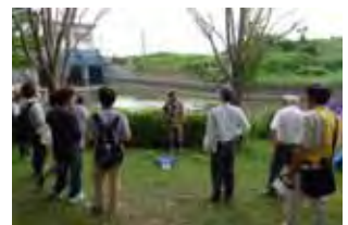
承水溝前での意見交換の様子