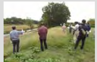
古鼠水辺公園の対岸付近から 川道の変化状況を確認