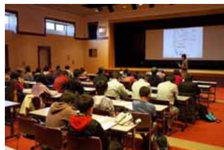
メダカ大学の講義の様子