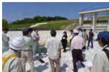
安永川排水樋門での意見交換の様子