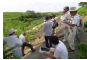
市木川での意見交換の様子