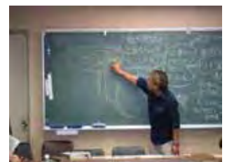
モデルワークの様子