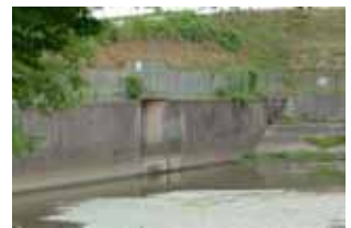
長池一承水溝の段差