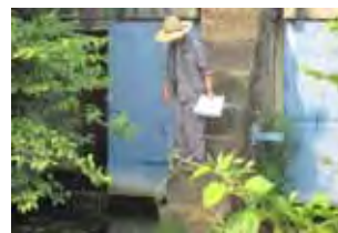
大見川合流部の段差の状況