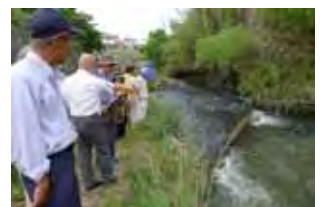
家下川合流点段差改善箇所