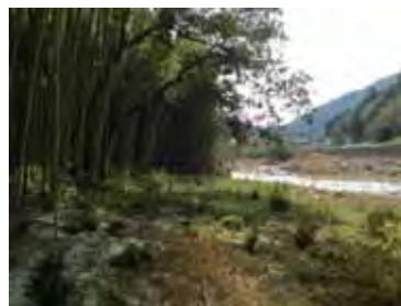
維持管理による利用しやすい河川空間