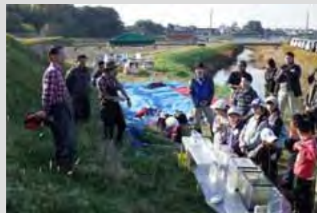
閉会の挨拶の様子