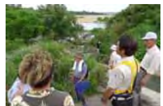
家下川合流点の導流堤