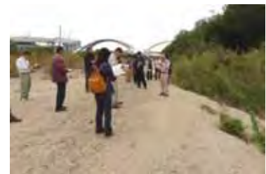
台風18号の出水後もワンド形状は保持