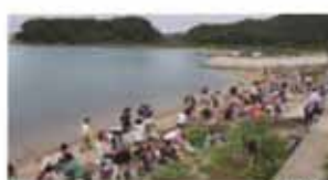
＜奈佐の浜海岸清掃＞