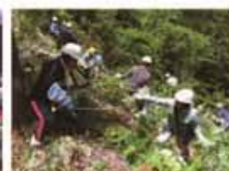
＜長良川上流域での森林づくり活動＞