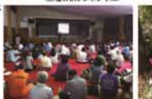
＜活動紹介・意見交換会＞