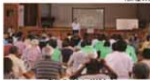
＜奈佐の浜シンポジウム＞