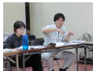
WGでの意見交換の様子