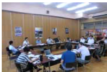
ブレインストーミングの様子