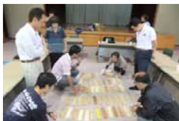
木材の多様さについての紹介