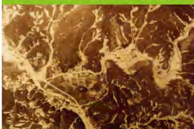
豊田市上川口町の土砂堆積状況 (豊田明智線)