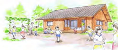
学童保育木造化プロジェクト