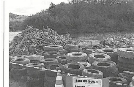
鵜の首の掘削工事では、投棄タイヤ等のゴミも驚くほどたくさん引きげられた

令和2年度から三河湾へ運ばれている砂は川底の掘削工事でも出たもので、国土交通省が受入れ先を探していたところ愛知県が三河湾の干潟造成用に引き取りを希望。うまくマッチングした。