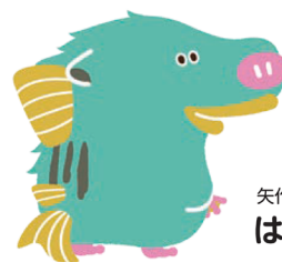
矢作川流域のゆるキャラ はぎぼう

http://www.cbr.mlit.go.jp/toyohashi/kaigi/yahagigawa/ryuiki-kondan/