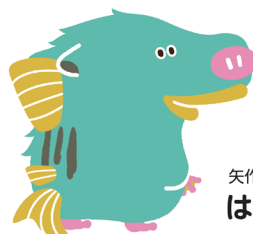
矢作川流域のゆるキャラ はぎぼう

http://www.cbr.mlit.go.jp/toyohashi/kaigi/yahagigawa/ryuiki-kondan/