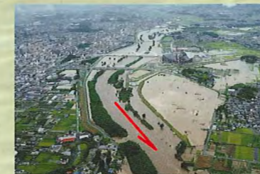
東海(恵南)豪雨時の状況 豊田市内