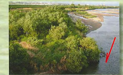
繁茂した河道内の樹木