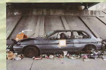
不法投棄された自動車