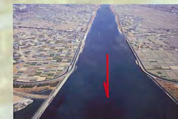
干涸、ヨシ原の減少した河口域