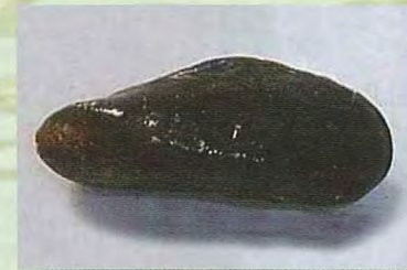
外来種(カワヒバリガイ)