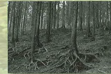
手入れされていない森林