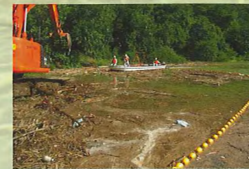
ダム貯水池の流木処理