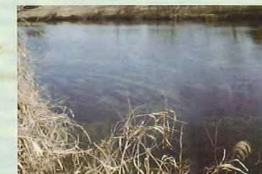
外来種(オオカナダモ)繁茂状況 豊田大橋付近