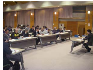
開催状況(根羽村・平谷村)