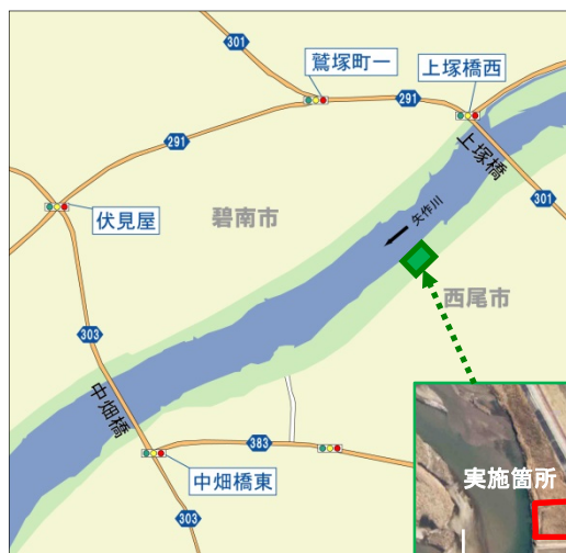
上塚橋より約 1km 下流 西尾緑地（駐車場付近）

※貴重品の管理や体験会でのケガ等については、参加される皆様方の自己責任でお願いいたします。