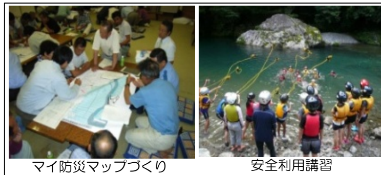
マイ防災マップづくり