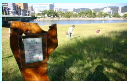
市民団体による看板設置事例（太田川）