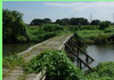
ピオトープの整備