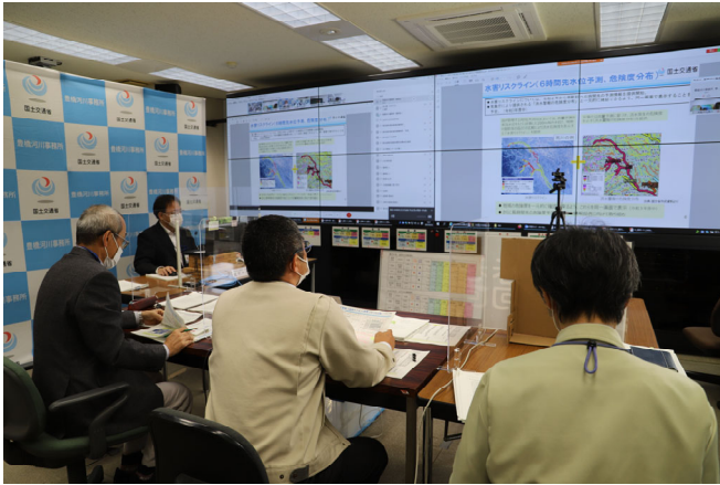
← 図 1. 会議写真 1 (事務局: 豊橋河川事務所)