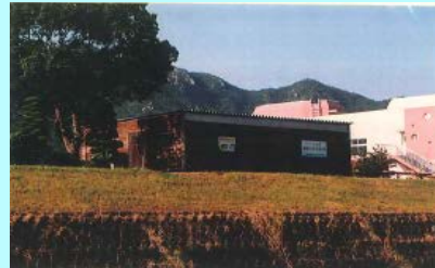
市民団体による活動拠点の整備事例（佐波川）

※ 河川管理者から河川管理施設の維持、除草等の委託を受けることも可能となります。委託先については、公募等の適正な手続きを経て選定を行う予定です。