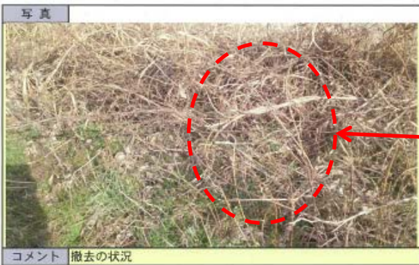
写真 河川愛護モニターからの報告に基づき、不法投棄物(タイヤ)の撤去を実施しました。 河川愛護モニターの皆様のご活躍が、河川の適切な維持管理に反映されています。 コメント