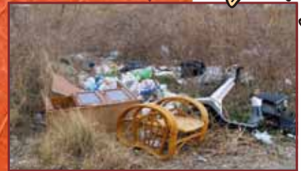
ますますゴミが増える