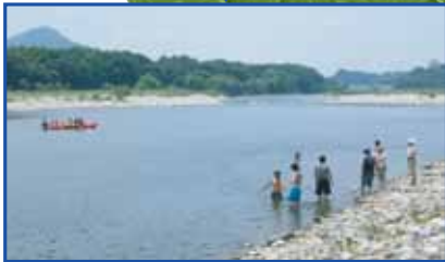
いつまでもきれいな水辺