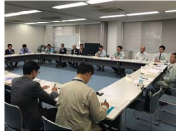
意見交換会の様子（名四国道事務所）